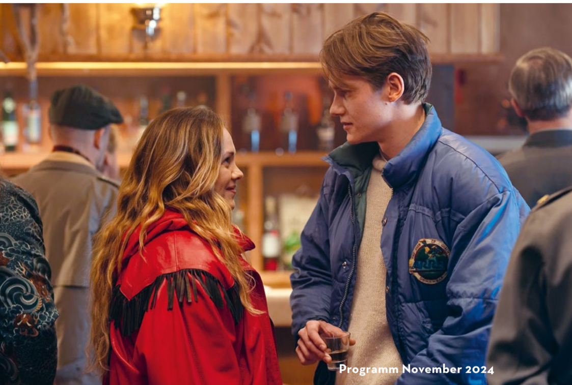
Programm November 2024