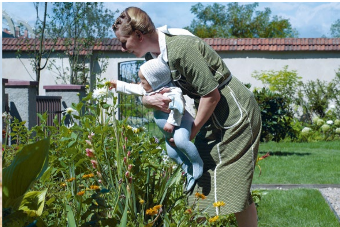
Programm März 2024